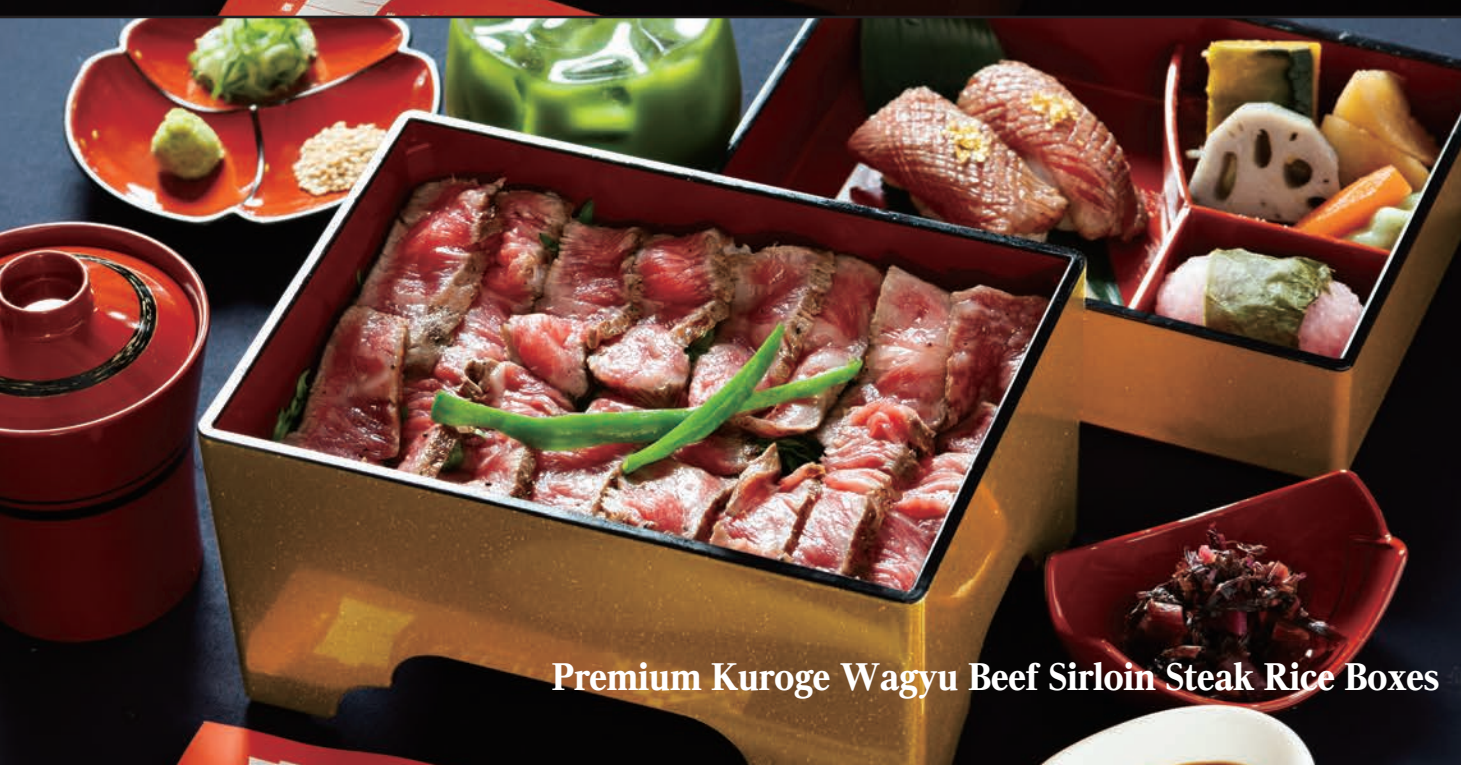
Premium Kuroge Wagyu Beef Sirloin Steak Rice Boxes