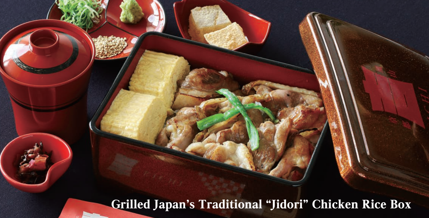
Grilled Japan's Traditional "Jidori" Chicken Rice Box