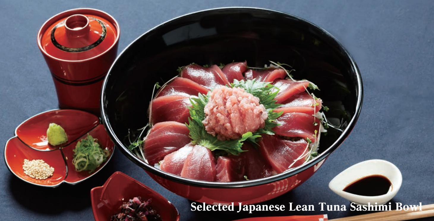
Selected Japanese Lean Tuna Sashimi Bowl