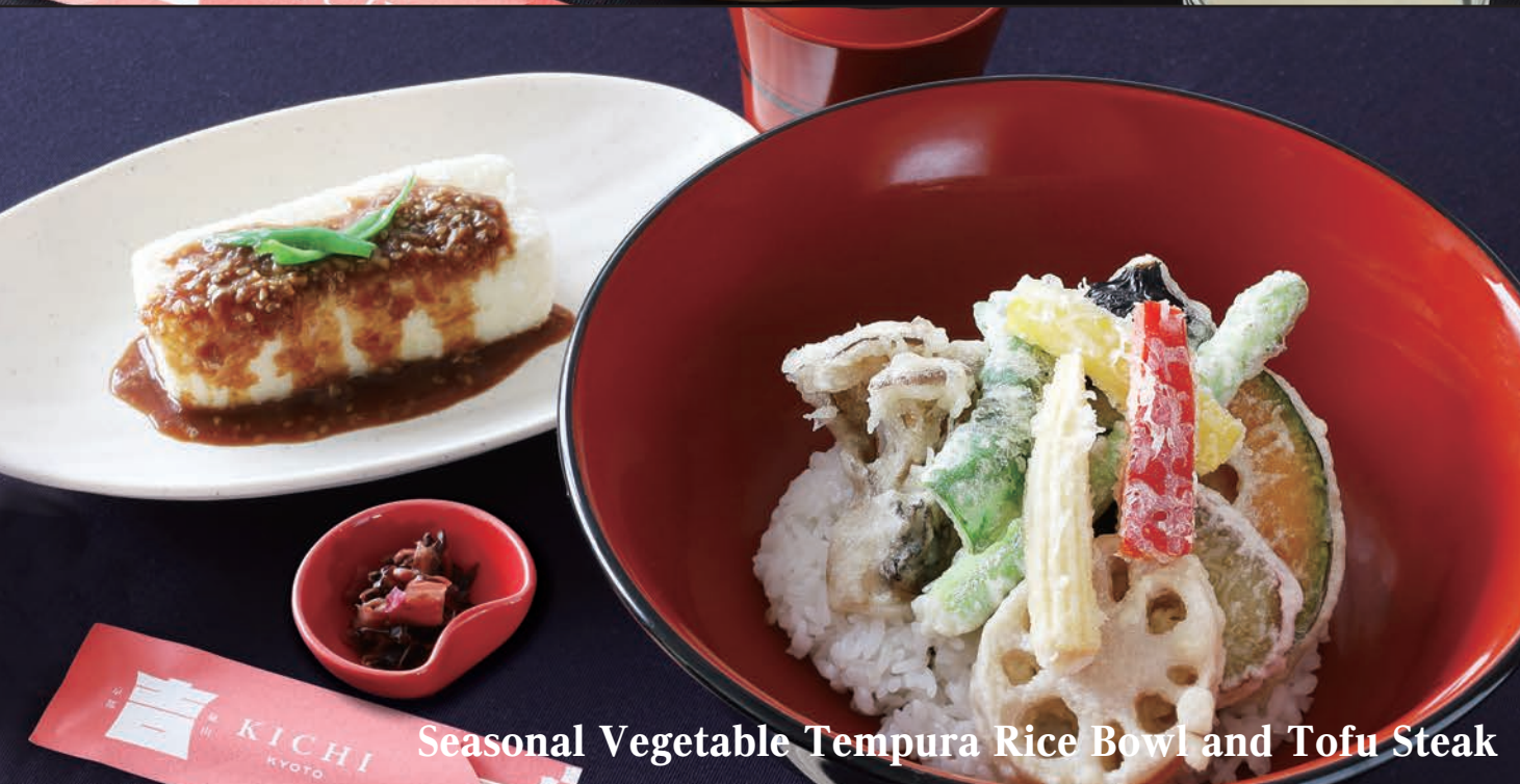
Seasonal Vegetable Tempura Rice Bowl and Tofu Steak