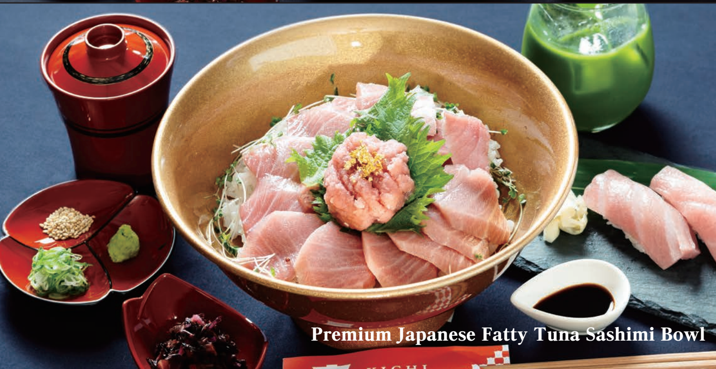
Premium Japanese Fatty Tuna Sashimi Bowl