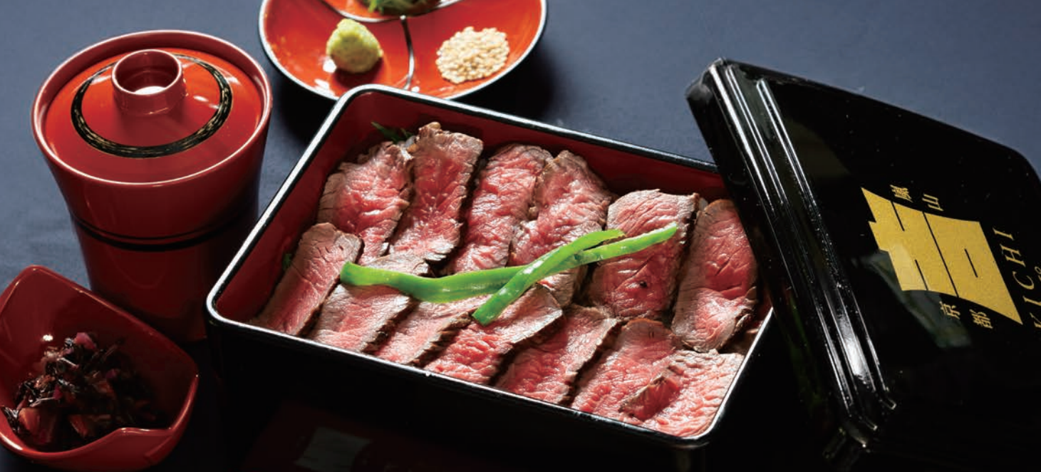
Selected Kuroge Wagyu Beef Lean Steak Rice Box