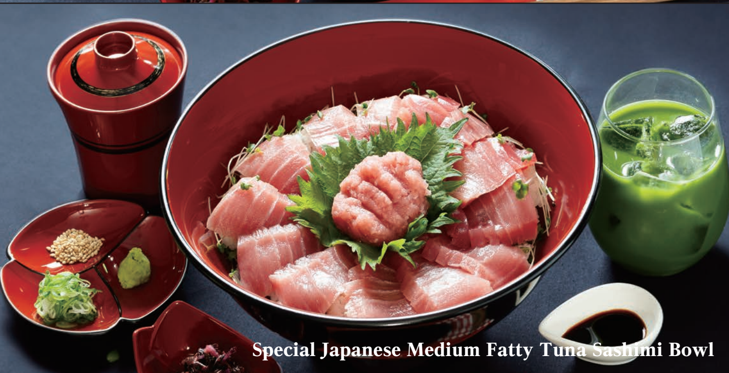
Special Japanese Medium Fatty Tuna Sashimi Bowl