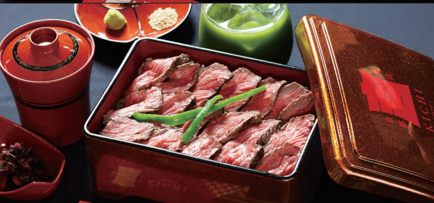
Special Kuroge Wagyu Beef Loin Steak Rice Box